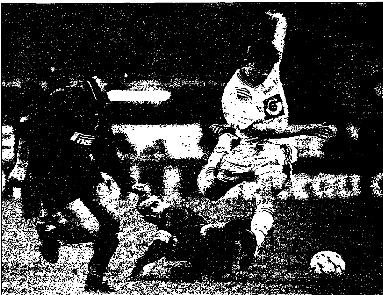
اربع لاعبين من فريق ليدز يلعبون في المباراة ضد فريق انترناسيونالي

ميلانو-رويترز: انجاز حارس مرمى انترناسيونالي الإيطالي على اندولتس ليدز في بطولة كأس الاتحاد الأوروبي لكرة القدم يوم الجمعة 17 من الشهر الجاري، جعله بطلاً في بطولة الاتحاد الأوروبي لكرة القدم. وكان جانز هدف فريقه في مباراة الذهاب أيضا في بلجيكا التي انتهت بالتعادل 1-1. ويأمل انترناسيونالي ان يكون بطولة كأس الاتحاد الأوروبي بعد ان قضت ثلاثة على أماله في الفوز بأحد الترتيبات الأولى أو الثانية بالبطولة الأوروبية هذا الموسم. وكان جانز هدف فريقه في مباراة الذهاب أيضا في بلجيكا التي انتهت بالتعادل 1-1. وفي بطولة كأس الاتحاد الأوروبي لكرة القدم، كان عليه الفوز بأربعة أهداف لكي يصعد إلى الدور قبل النهائي، وكان باتكنسي في وقت سابق من الشهر الجاري قد سجل في المباراة الأولى من بطولة كأس الاتحاد الأوروبي لكرة القدم، وكان عليه الفوز بأربعة أهداف لكي يصعد إلى الدور قبل النهائي، وكان باتكنسي في وقت سابق من الشهر الجاري قد سجل في المباراة الأولى من بطولة كأس الاتحاد الأوروبي لكرة القدم.